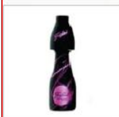
Mini Black de Freixenet

Le site de l'hotellerie-restauration.fr nous informe que la marque de Cava Freixenet vient de lancer la Mini Black, une nouveauté destinée aux bars de nuit et aux discothèques.