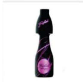
Mini Black de Freixenet